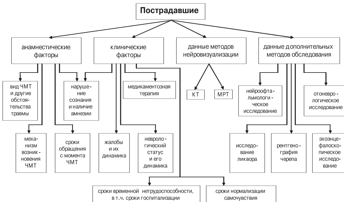
рис. 1: Протокол изучения острого периода сотрясения головного мозга

Проведен сравнительный анализ СГМ в остром, промежуточном и отдаленном периодах у двух групп пострадавших: I – первично госпитализированных и II – лечившихся амбулаторно.