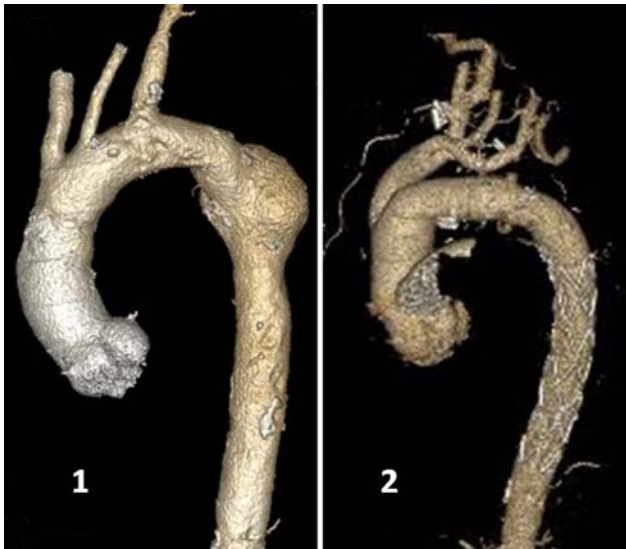
Рис. 2. Аневризма грудной аорты. Собственное наблюдение. 1 – до операции. Аневризма в проксимальной части нисходящего отдела аорты с явлениями атероматозного перерождения стенки дуги аорты, 2 – после операции. Аневризма “выключена” из кровотока, выполнено протезирование дуги с дебрингом супраоральных сосудов

ликация, освещающая вопрос реконструкции атеросклеротических аневризм дуги и нисходящего отдела аорты с использованием техники “замороженного хобота слона”. Однако существуют некоторые особенности имплантации гибридного стент-графта у данных пациентов. Необходимо наличие подходящей “зоны посадки” дистальной части гибридного кондукта. Также необходимо, чтобы конduit превышал общий размер аорты на уровне дистальной зоны имплантации на 10–20% [3, 11]. На основании дооперационных инструментальных данных важно определить хирургическую стратегию. Захват аневризмой дуги и проксимальной части нисходящей аорты предполагает выполнение реконструкции открытым способом одномоментно с установкой стент-графта в нисходящую аорту. Таким образом, конduit “E-vita open plus” позволяет исключить из кровотока аневризму дуги и проксимальной части нисходящей аорты с очагами распада атероматозных масс в нисходящей аорте (рис. 2). При распространении аневризмы на весь нисходящий отдел реконструкцию проксимальных отделов аорты дополняют эндоваскулярной установкой стент-графта в дистальную часть нисходящей аорты, которая требуется, по данным литературы, у 11% пациентов [11, 16].