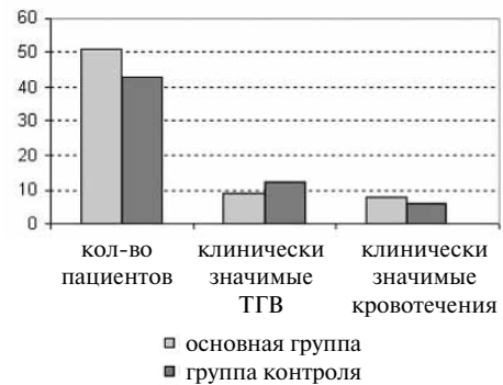
Рис. 1. Общее количество наблюдений и выявленные осложнения

Не было выявлено значимых отличий в частоте встречаемости клинически выраженных тромбозов глубоких вен нижних конечностей. Сонографические подтверждения были выявлены у 4 (19,1%) пациентов основной и у 6 (27,2%) контрольной группы. Клинически значимые кровотечения в виде геморрагических пятен вокруг краев раны были выявлены у 3 (14,28%) пациентов основной и 1 (4,5%) пациента контрольной группы, при этом разница показателей между группами не была достоверной (рис. 1.)