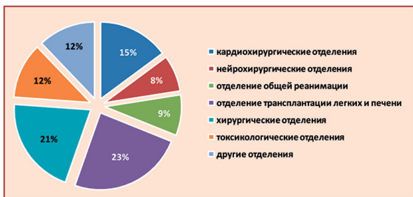
Рис. 3. Потребность клинических отделений НИИ скорой помощи им. Н.В. Склифосовского в КЭ в 2013 г.