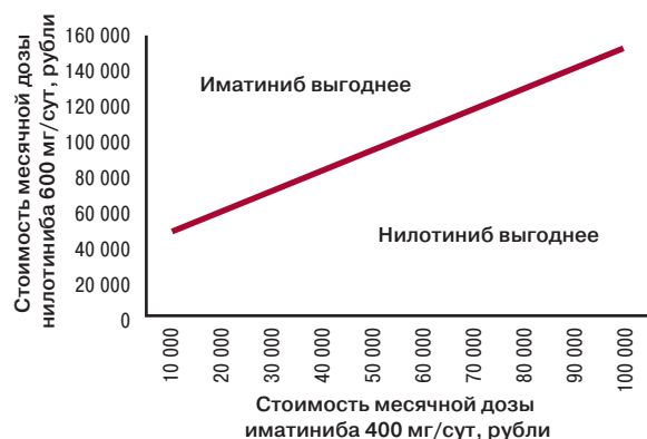
Рис. 4. Пороговые значения стоимости для экономической выгоды нилотиниба и иматиниба в первой линии терапии ХМЛ

Данные, получаемые в реальной клинической практике, как правило, отличаются от результатов клинических исследований. Использование таких данных, как входные параметры в представленных моделях, позволит прогнози-