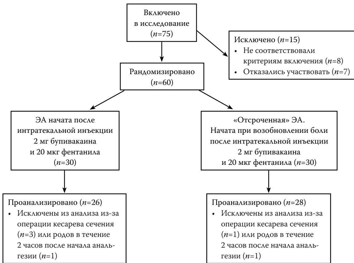
Рис. 1. Диаграмма последовательности распределения рожениц по исследуемым группам