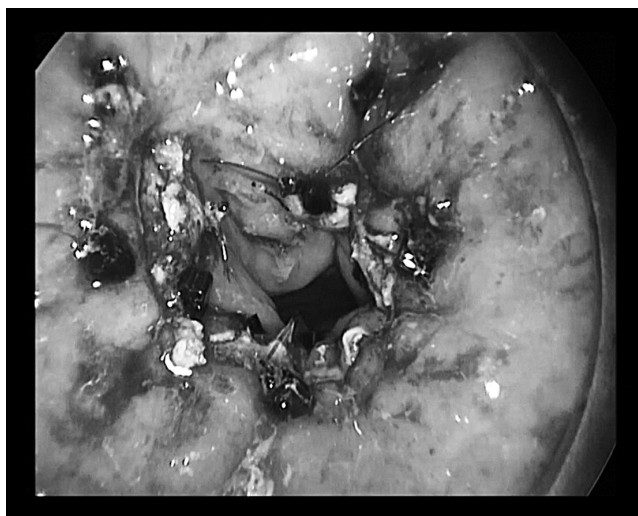
Рисунок 3. Дефект прямой кишки ушит в поперечном направлении

редней стенке — у 30% больных, на боковых стенках — у 10% больных.