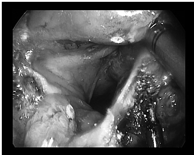
Рисунок 1. Иссечение стенки прямой кишки с опухолью