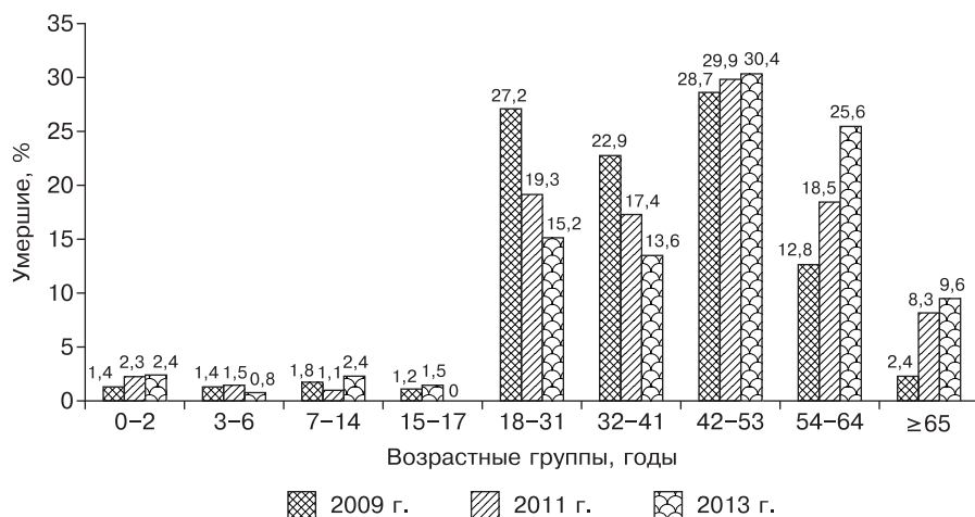
Рис. 2. Возрастная структура умерших от лабораторно подтвержденного гриппа во время эпидемий с участием вируса пандемического гриппа А(H1N1)pdm09 (2009, 2011 и 2013 гг.).

Число зарегистрированных летальных исходов лабораторно подтвержденного гриппа в наблюдаемых городах снизилось с 645 случаев (в пандемию 2009 г.) до 264 (2011 г.) и 125 (2013 г.). В возрастной структуре умерших от гриппа в первую волну пандемии преобладали лица в возрасте от 18 до 53 лет (78,8%), при этом доля каждой из трех возрастных категорий (18–31, 32–41, 42–53 года) была приблизительно