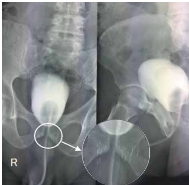
Рис. 3. Цистография. Распространение контрастного вещества за пределы уретрошеечного анастомоза не определяется, визуализируются зерна, расположенные в парапростатической ткани

мия. Время операции составило 125 мин. Интраоперационных осложнений не отмечено (рис. 2).