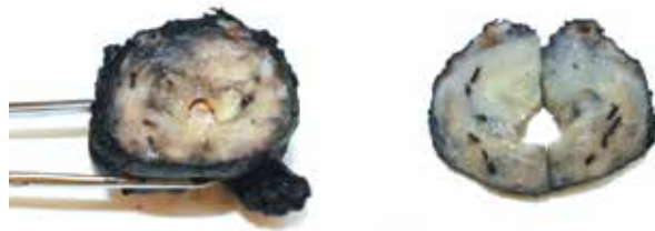
Рис. 4. Макропрепарат удаленной ПЖ

При патогистологическом исследовании (рис. 4) в области нижней и средней части ПЖ справа, верхней части ПЖ с обеих сторон определялся рост ацинарной аденокарциномы ПЖ с сохраненной морфологической структурой, индексом Глисона 7 (4 + 3). В области нижней части ПЖ слева определялся фокус аденокарциномы с картиной лучевого патоморфоза. Диаметр опухоли, располагающейся в области нижней части ПЖ справа, составил 0,5 см, средней части ПЖ справа – 1,2 × 0,7 см,