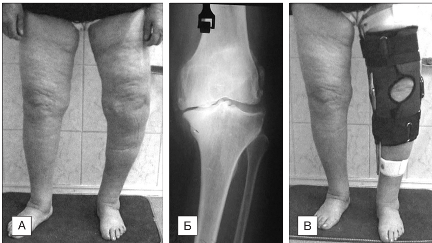
Рис. 1. Пациентка К. 67 лет, 2-я группа наблюдения. А — деформация оси конечности, Б — рентгенограмма (прямая проекция), В — внешний вид в ортезе.

Во 2-й группе (312 человек) у 11,8% отмечена вальгусная, и у 70% — варусная деформация оси нижней конеч-