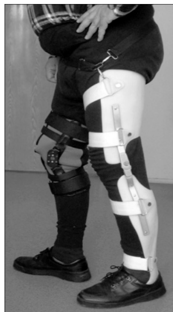
Рис. 2. Пациент А. 58 лет, в аппарате (3-я группа наблюдения).

В 3-й группе из 39 пациентов при отказе от эндопротезирования у 32 применили рамочные ортезы или полный