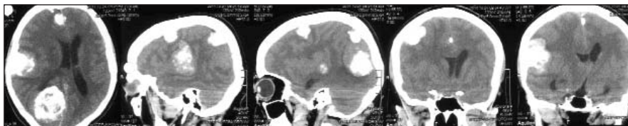
Рис. 1. КТ до операции (описание в тексте)

Сделан вывод о том, что на первом плане в клинической картине находятся нарушения в зрительно-пространственной сфере, что соответствует преимущественному поражению