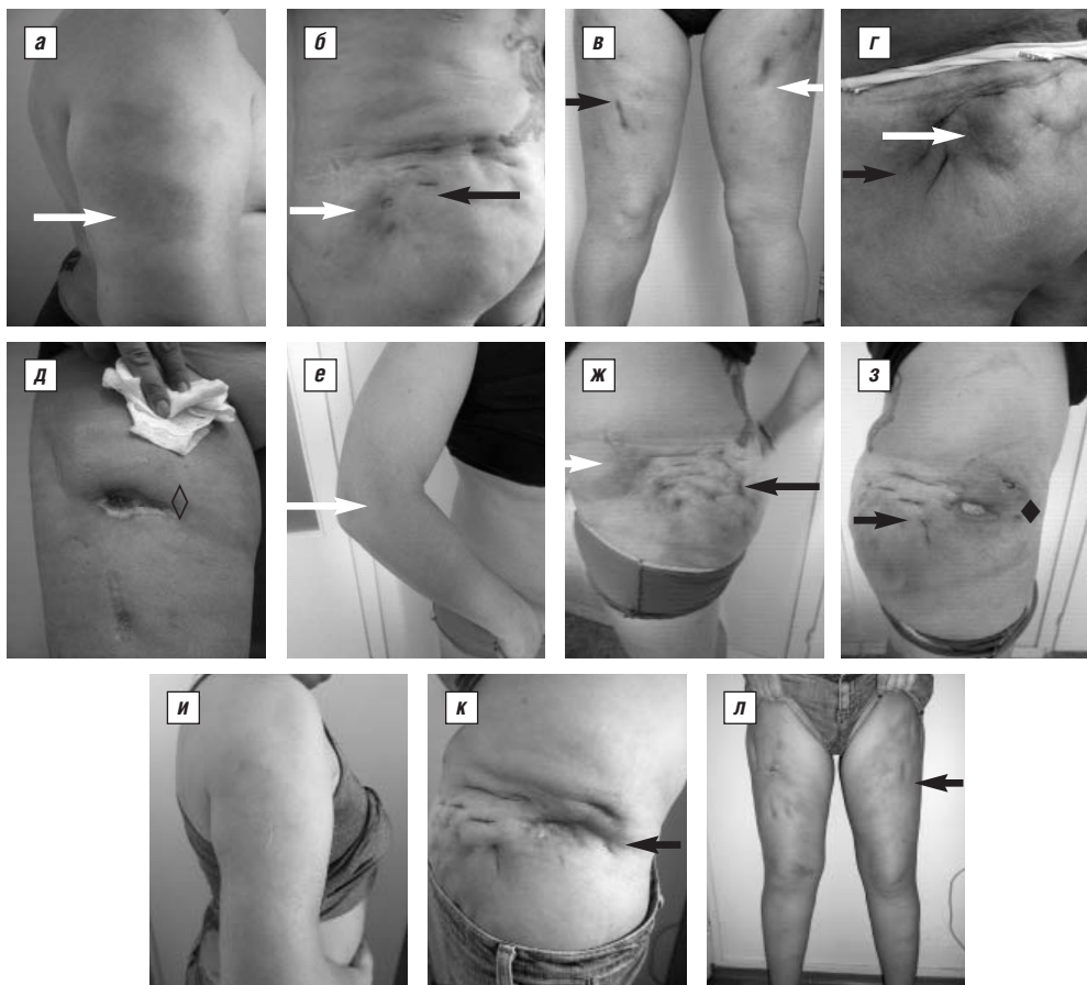
Рис. 1. Больная М. с ИПВК со множественными резко болезненными уплотнениями (белые стрелки) и рубцами (черные стрелки) на верхних и нижних конечностях, на передней поверхности правого бедра (◊) и на правой ягодичной области (◆) – трофический дефект размером 3×7 см с истечением кремообразной массы. Динамика клинических признаков ИПВК на фоне проводимой терапии: а–в – май 2011 г., до лечения; г–д – сентябрь 2011 г., на фоне лечения метипредом 8 мг/с и микрофенолата мофетиллом 1,0 г/сут; е–з – декабрь 2012 г., после терапии преднизолоном 10 мг/сут, ЭТЦ 50 мг подкожно один раз в неделю и метотрексатом 15 мг/нед; и–л – июнь 2013 г., через 6 мес терапии АДА 40 мг подкожно один раз в 2 нед, преднизолоном 15 мг/сут и метотрексатом 15 мг/нед

ная флегмона обоих бедер, проводились иссечение и дренирование очагов, антибактериальная терапия – без эффекта. При поступлении в клинику Института ревматологии состояние относительно удовлетворительное. На коже ягодиц и передней поверхности бедер множественные рубцы. На медиальной поверхности обоих плеч – воспалительные очаги диаметром 20 см. На левом бедре – зреющий узел диаметром 7 см, боль по ВАШ – 90 мм (рис. 1, а–в). Данные анализов крови: Hb 90 г/л, л. 16,6 \cdot 10^9/л , п. 5%, сегментоядерные нейтрофилы (с.) 70%, СОЭ 50 мм/ч, лактатдегидрогеназа (ЛДГ) 268 Ед/л, амилаза 57,2 ммоль/л, ферритин 164,6 мкг/л, креатинфосфокиназа (КФК) 387 Ед/л, \gamma -глобулины 26,56%, альбумины 48,21%, СРБ 134 мг/л. Интерлейкин 1 \beta (ИЛ1 \beta ) <1,0 пг/мл (норма 0–11), ИЛ8 <1,0 пг/мл (норма 0–10), ИЛ10 <1,0 пг/мл (норма 0–31), ФНО \alpha 3,36 пг/мл (норма 0–6). Сывороточное содержание глюкозы, холестерина (ХС), трансаминаз, креатинина, общего белка, ревматоидного фактора (РФ), антител к ДНК, анти-нуклеарных антител (АНА), антинейтрофильных цитоплазматических антител (АНЦА), антистрептолизина О (АСЛЮ), криоглобулинов, С3с, С4с, IgG и IgM антител к кардиолипину, \alpha 1-антитрипсина – в пределах нормы. Проба Манту: папула 5 мм. При компьютерной томографии (КТ) грудной клетки свежих очаговых и инфильтративных изменений в легких не