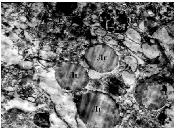
Рис. 3. Ліпідні гранули в стромі ясен. Електроннограма. Збільшення x 7 000. ЛГ - ліпідні гранули, Пл - плазмоцит, Ф - фібробласт

У підепітеліальному шарі стромі ясен спостерігається велика кількість плазматичних клітин. У їхній цитоплазмі містяться ліпідні гранули. Збільшується кількість рибосом, каналці ендоплазматичного ретикулуму розширені, кристи більшості мітохондрій зруйновані, пластинчастий комплекс Гольджі набряклий. Усе це свідчить про зміну секреторної функції клітин.