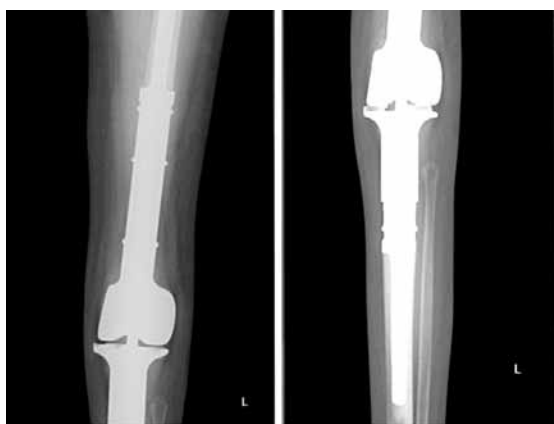
Рис. 2. Послеоперационная рентгенография пациента 3.

EURAMOS/KOSS1. В плановом порядке больной проведено оперативное лечение. Выполнено удаление опухоли с эндопротезированием коленного сустава и проксимального отдела большеберцовой кости «растущим» неинвазивным протезом, ротация медиальной головки икроножной мышцы. Объем замещения составил 170 мм. Использовались ножки с бесцементной фиксацией (рис. 4). В послеоперационном периоде применялась иммобилизация коленного сустава в шарнирном ортезе в течение 8 нед, пациентка передвигалась при помощи костылей в течение 6 нед.