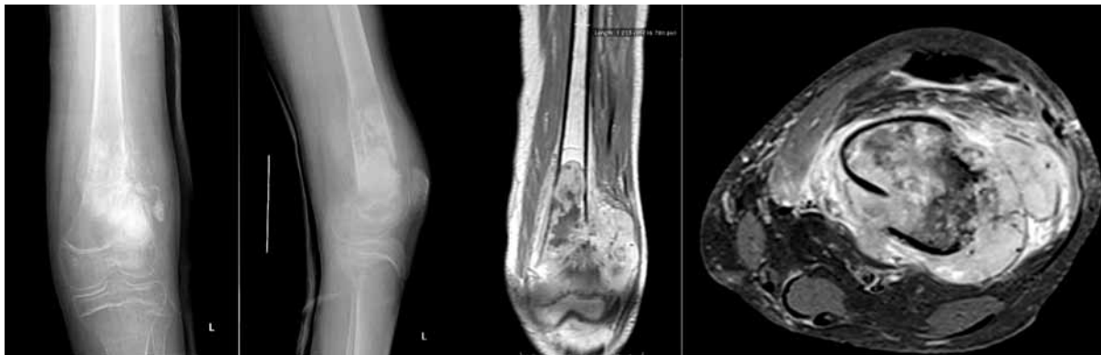
Рис. 1. Рентгенография и магнитно-резонансная томография патологического очага левой бедренной кости пациента 3.