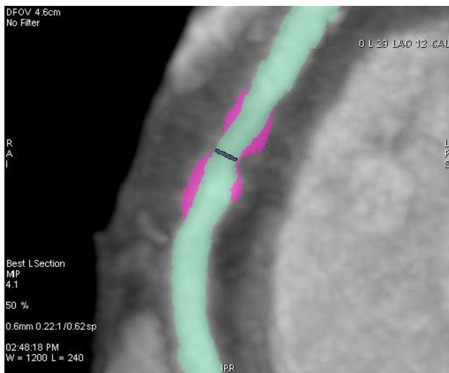
Б. Структурное ремоделирование правой коронарной артерии эксцентрично расположенной атеромой

Стенотическое поражение правой коронарной артерии. Результаты контрастной мультиспиральной компьютерной томографии ангиографии