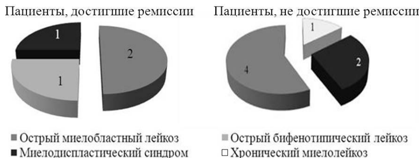
Рисунок 2 — Структура онкогематологических заболеваний у пациентов, в зависимости от достижения ими полной клинико-гематологической ремиссии

После окончания курсов высокодозной химиотерапии по программам FLAG и FLAG-Ida у 4 пациентов (36 %) достигнута полная клинико-гематологическая ремиссия. Онкогематологическая патология данной группы пациентов в сравнении с пациентами, не достигшими ремиссии, представлена на рисунке 2.