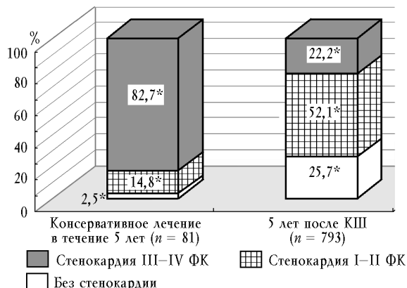
Рис. 2. Сравнение клинических проявлений ИБС при консервативном лечении и коронарном шунтировании через 5 лет после операции:

Консервативное лечение ИБС имеет многолетнюю историю. Коронарное шунтирование применяется последние десятилетия при высоком функциональном классе стенокардии и безуспешности медикаментозного лечения. Так как в отдаленном периоде результаты коронарного шунтирования значительно ухудшаются, представляет интерес сравнение отдаленных результатов консервативного и оперативного лечения, оценка антиангинальной эффективности, толерантности к нагрузке и смертности. Через 5 лет после оперативного лечения у 25,7% больных не выявлена стенокардия (рис. 2), в то время как при медикаментозном лечении только 2,5% не имели приступов стенокардии при привычной физической нагрузке ( p < 0,01 ). В группе пациентов, получавших консервативное лечение, отмечалось значительное преобладание лиц с тяжелыми функциональными классами стенокардии (III–IV ФК) по сравнению с оперированными больными – 82,7 и 22,2% соответственно ( p < 0,05 ), достоверное увеличение числа перенесенных инфарктов – 18,5 и 7,4% ( p < 0,05 ), повторных госпитализаций – 63,0 и 22,2% соответственно ( p < 0,01 ). Летальность за 5 лет в группе консервативного лечения также была значительно выше по сравнению с оперативным лечением – 33,9 и 9,4% соответственно ( p < 0,05 ).