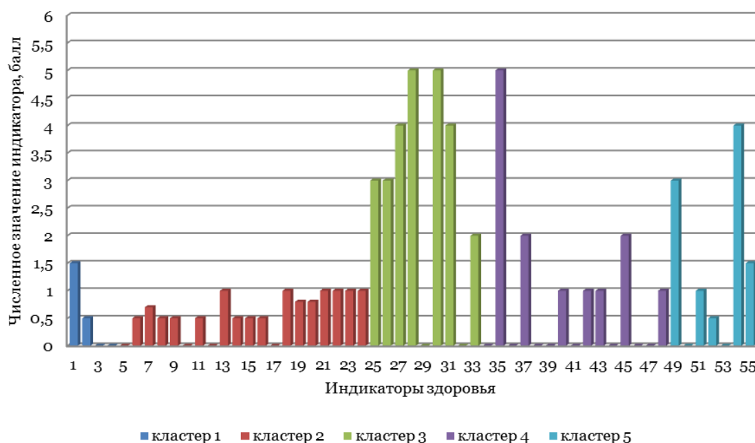
Рис. 3. Визуальный образ состояния здоровья пациента В., 74 г.

Этот клинический случай наиболее ярко демонстрирует разнородность результатов оценки П с помощью различных методик и возможное занижение ее степени, по сравнению с МКОП, при использовании методик CIRS, Kaplan-Feinstein и, в особенности, – Charlson.