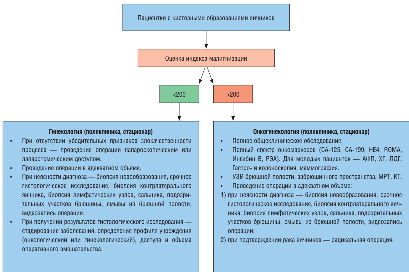
Рис. 2. Медико-организационные аспекты ведения пациенток с кистозными образованиями яичников с использованием индекса малигнизации.

разованиями яичников. Дифференцированный подход в зависимости от показателя индекса позволяет оптимизировать медико-организационные аспекты ведения таких больных, своевременно изменив тактику и направив пациентку в профильное учреждение. Медико-организационные аспекты представлены на рис. 2.