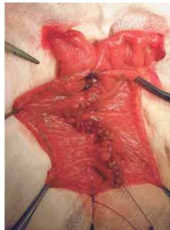
Рис. 1. Создание задней стенки резервуара из U-образно сложенной петли тонкой кишки

Наиболее оптимальным является одноэтапное выполнение оперативного вмешательства [10–14]. Одна-