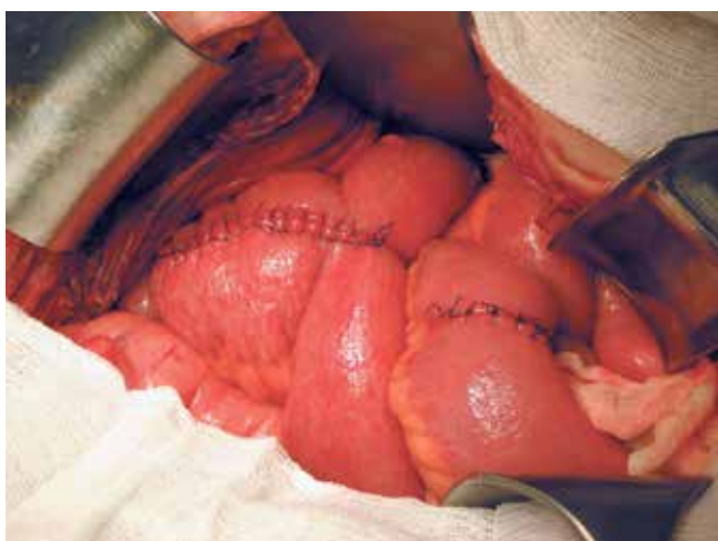
Рис. 4. Окончательный вид наполненного жидкостью резервуара

дефиците их тканей и необходимости создания высоких анастомозов, оптимальным методом является Y-образная илеоуретероцистопластика по разработанной нами методике, при которой недетубуляризованные концы резервуара используются для восполнения дефицита верхних мочевых путей (МП) (патент на изобретение № 2199281 от 27.02.2003). Резецированный