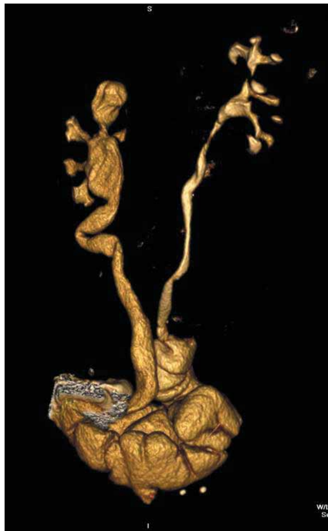
Рис. 6. КТ больного Л., 59 лет, через 8 лет после двусторонней Y-образной илеоуретероцистопластики