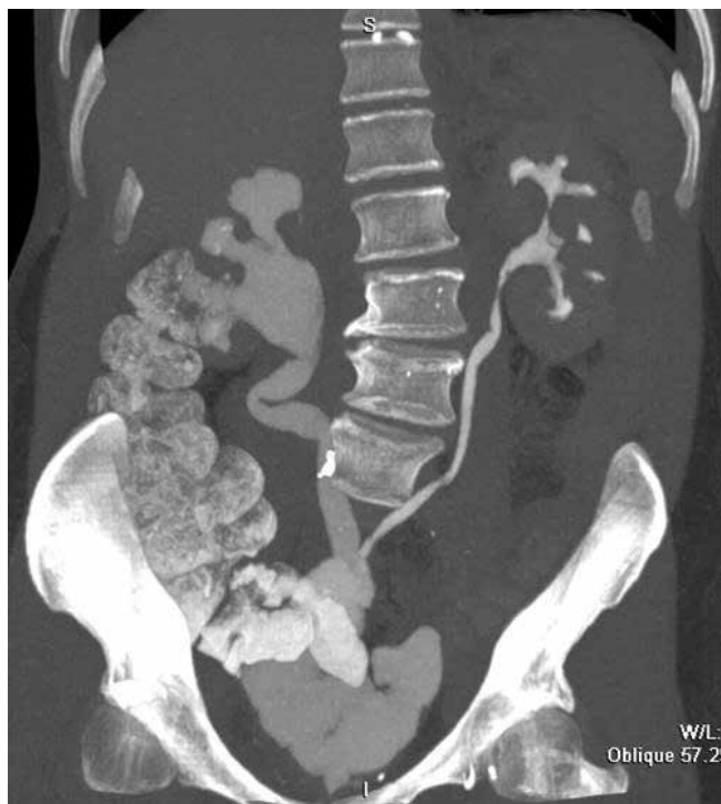
Рис. 5. КТ больного Л., 59 лет, через 3 года после двусторонней Y-образной илеоуретероцистопластики

и методов отведения мочи. В дальнейшем были разработаны профилактические мероприятия, включающие подготовку кишечника фортрансом, предоперационную диету, фиброгастроуденоскопию. Усовершенствованы также техника самой операции, методики анестезиологического пособия и послеоперационного ведения больных. В результате количество послеоперационных осложнений существенно снизилось.