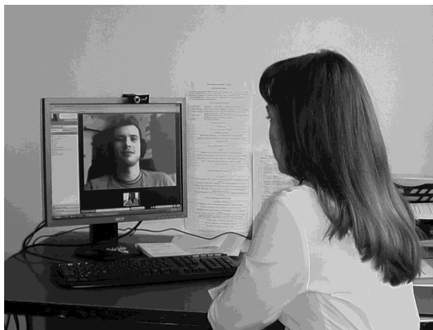
Рис. 1. Работа реабилитолога в режиме Skype

В первом этапе, продолжавшемся 6 мес, участвовали шесть пациентов, полученные результаты были опубликованы в 2008 г. [3]. В данной статье оцениваются и предварительно анализируются результаты промежуточного этапа развития проекта дистанционного биоуправления, апробированного на большем количестве пациентов.