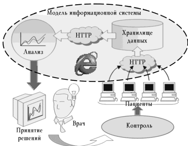
Рис. 2. Схема дистанционного биоуправления

программного обеспечения интернет-сервера (портала) (рис. 2).