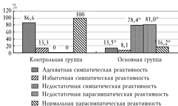
Рис. 1. Реактивность отделов вегетативной нервной системы в основной и контрольной группах (активная ортостатическая проба): * — достоверность различий с группой контроля ( p < 0,05 )

При анализе реактивности симпатического отдела ВНС в 78,4% случаев выявлена недостаточная (асимпатикотоническая) реактивность, где отношение IN_2/IN_1 составляло 0,4 \pm 0,7 , что могло свидетельствовать о неадекватности активации симпатико-адреналовой системы и функциональной десимпатизации (рис. 1).