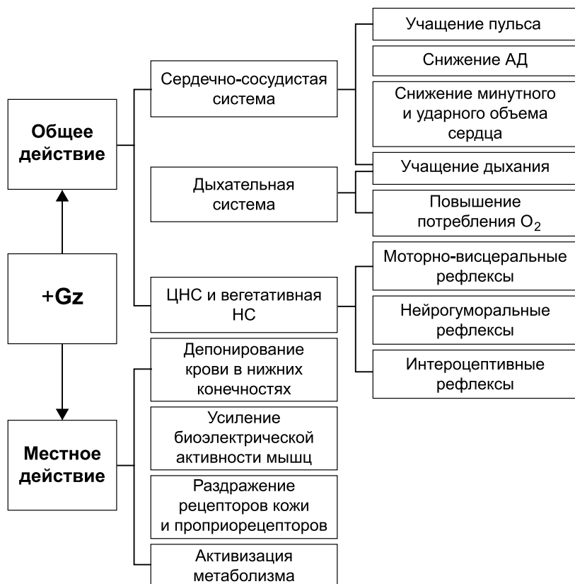
Рис. 2. Схема общих и местных эффектов повышенной гравитации.

Имеющаяся экспериментальная и клиническая база данных позволила определить параметры терапевтического дей-