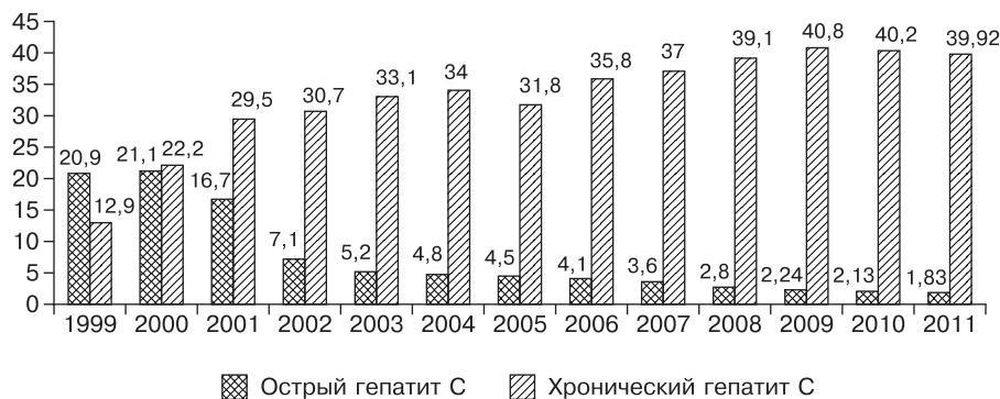
Рис. 2. Заболеваемость острым и хроническим гепатитом С (на 100 000 населения).

стях, Республике Бурятия доля носителей ВГВ среди хронических форм инфекции составляет выше 70%, то в Республике Тыва, Республике Алтай, Новосибирской области она не превышает 30%. Такая вариативность уровней заболеваемости и носительства ВГВ в значительной мере определяется качеством диагностики и полнотой регистрации этого вида патологии [16].