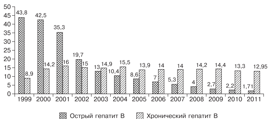
Рис. 1. Заболеваемость острым и хроническим гепатитом В (на 100 000 населения).