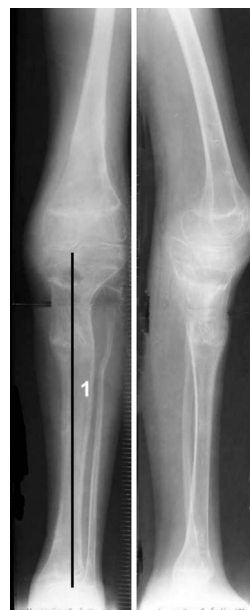
Рис. 4. Рентгенограммы левой нижней конечности больного И. после лечения