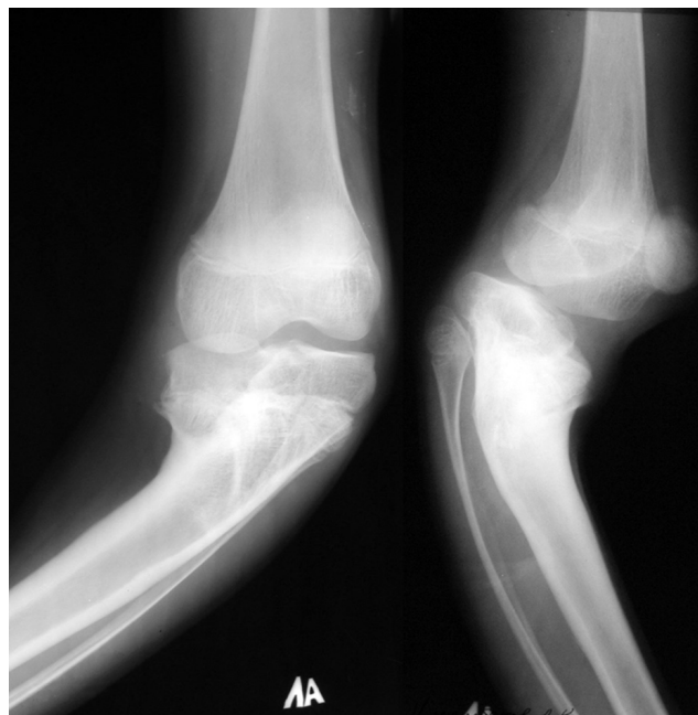
Рис. 2. Рентгенограммы левого коленного сустава в прямой и боковой проекции пациента И. до лечения