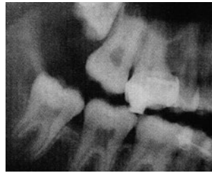
Рис. 5. Полуретенция, дистопия 3.8 зуба