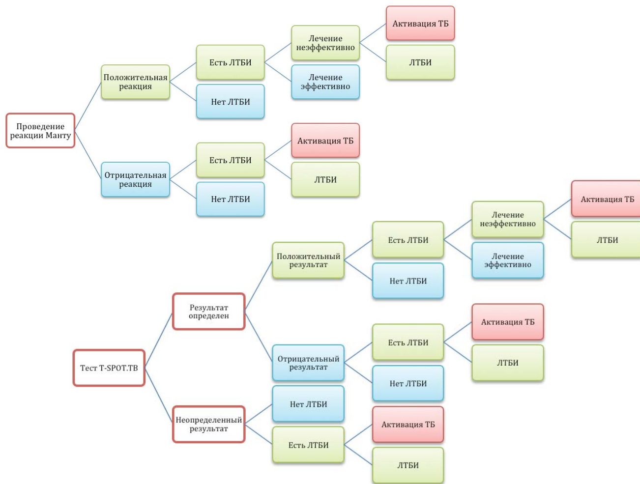
Рисунок 1. Структура модели для сравнения сценариев выявления латентной туберкулезной инфекции у иммунокомпрометированных детей.

кованных результатов систематического обзора, изучавшего эффективность химиопрофилактики туберкулеза изониазидом у детей [6].