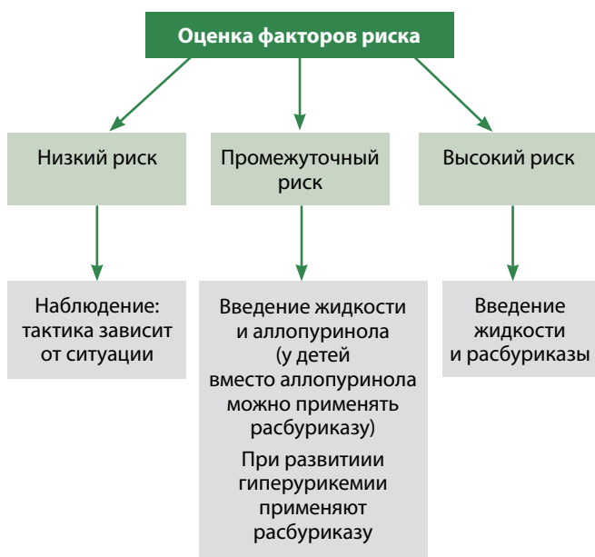
Рис. 2. Алгоритм профилактики и лечения гиперурикемии

У детей из группы промежуточного риска помимо введения жидкости можно применять аллопуринол