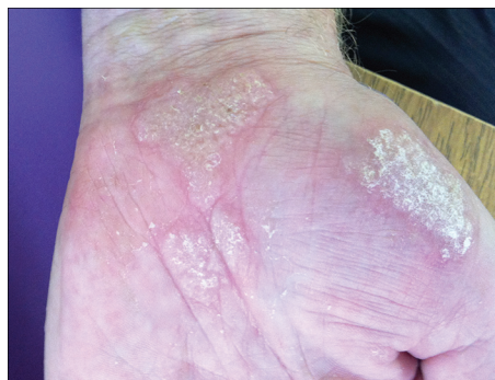
Рис. 1. Б о л ь н о й К. Кератодермия бородавчатая узелковая Лорта—Жакоба. Поражение левой ладони.

Биохимический анализ крови: мочевины 8,4 ммоль/л (норма 1,7—7,3), креатинин 135,1 мкмоль/л (норма 71—115 мкмоль/л), коэффициент атерогенности 4,32 (норма 0,1—2,9), общий билирубин 24,9 мкмоль/л (норма 3,4—18,8 мкмоль/л), связанный билирубин 5,7 мкмоль/л (норма 0,1—5,1 мкмоль/л), свободный билирубин 19,2 мкмоль/л (норма 0,6—17 мкмоль/л), АЛТ 54 ЕД/л (норма до 45 ЕД/л).