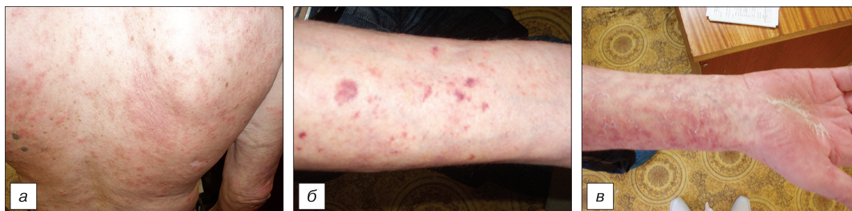
Рис. 4. Б о л ь н о й Ш. Псориазiformный акракератоз Базекса (эритематозно-сквамозные очаги различной локализации). а — верхняя треть спины; б — разгибательная поверхность предплечий; в — сгибательная поверхность предплечий.

Несмотря на проводимую терапию, отметили распространение высыпаний и усиление зуда. Клиническая картина почти универсального поражения кожи и нарастание зуда позволили присоединить Sol. Diprospran 2,0 мл внутримышечно на курс 4 инъекции; наружно — мазь Элоком 1 раз в день и мазь Машкилейсона 2 раза в день. В результате терапии наблюдали положительную динамику в виде регресса высыпаний на 60—70%.