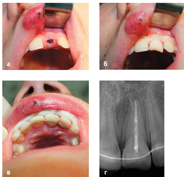
Рис. 2. Этапы операции реплантации: а) медикаментозная обработка лунки зуба, б) установка зуба в альвеолу, в) шинирование, г) прицельная внутриротовая рентгенограмма спустя 1 месяц

Через 1 месяц после операции реплантации пациентка предъявляла жалобы на некоторое изме-