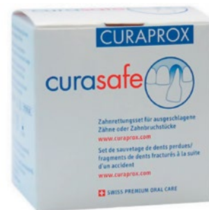
Рис. 1. Варианты хранения и транспортировки зуба, подвергнувшегося полному вывиху: а) физиологический раствор, б) контейнер «CuraSafe» (Curaprox)

ограничить жевательную нагрузку. Пациентка была предупреждена о вероятном изменении цвета зуба в результате потери его жизнеспособности.