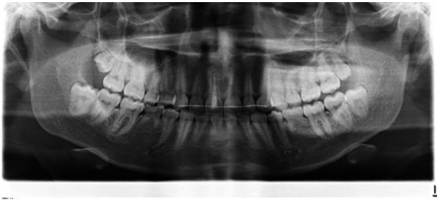
Рис. 3. Ортопантомограмма пациентки Г. после операции реплантации, шинирования и депульпирования зуба 1.1