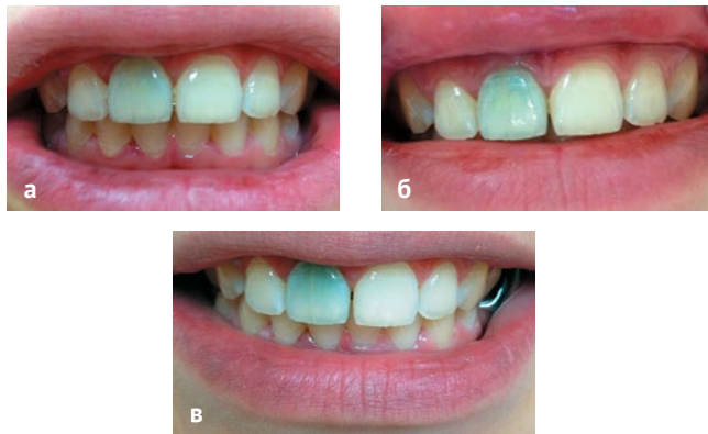
Рис. 4. Status localis в контрольные сроки после операции реплантации:

а) через 1 месяц, б) через 6 месяцев, в) через 1 год