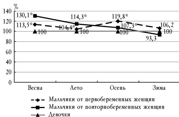
Рис. 1. Половая дифференцировка плода у перво- и повторнобеременных женщин в зависимости от сезона его зачатия: процентное отношение числа мальчиков к числу девочек, принятому за 100% (* – p < 0,05 )

Таким образом, при первой беременности наиболее благоприятным для формирования зародышей мужского пола является осеннее время года, а при последующих – весеннее.