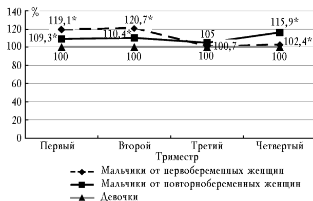
Рис. 2. Половая дифференцировка плода у перво- и повторнобеременных женщин в зависимости от того, в какой триместр индивидуального годичного цикла матери произошло зачатие: процентное отношение числа мальчиков к числу девочек, принятому за 100% (* – p < 0,05 )

Максимальное количество новорожденных мужского пола у первобеременных женщин имело место после зачатия во втором триместре ИГЦ матери: оно составило 120,7 на 100 новорожденных женского пола (рис. 2). Это может быть объяснено приведенными выше данными об изменениях уровня здоровья в зависимости от триместра их индивидуального годичного цикла [2, 4, 5].