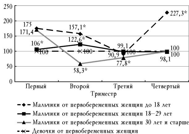
Рис. 4. Половая дифференцировка плода в зависимости от того, в каком триместре ИГЦ матери произошло зачатие у первобеременных женщин разных возрастных групп: отношение числа мальчиков к числу девочек, принятому за 100% (* — p < 0,05 )

У юных первобеременных женщин наибольшая частота зачатия плодов мужского пола имеет место в четвертом триместре ИГЦ матери.