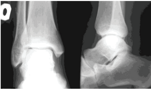
Рис. 3. Больной Б., 28 лет. Контрольная рентгенография голеностопного сустава, подтаранного сустава и Шопарова сустава правой стопы через 3 года после оперативного лечения: суставы конгруэнтны