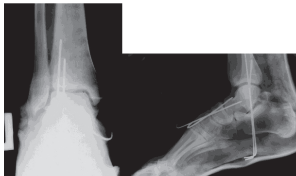
Рис. 2. Больной Б., 28 лет. Контрольная рентгенография правой стопы после открытой репозиции: устранён ротационный подвывих таранной кости, вывих пяточной кости, вывих в Шопаровом суставе, фиксация спицами Киршнера

В наших наблюдениях группа больных с переломовывихами в суставе Лисфранка составила 7 человек. Всем больным при поступлении произведена первичная открытая репозиция переломовывиха плюсневых костей с последующей трансартикулярной фиксацией спицами. Спицы удаляли через 6-8 недель.