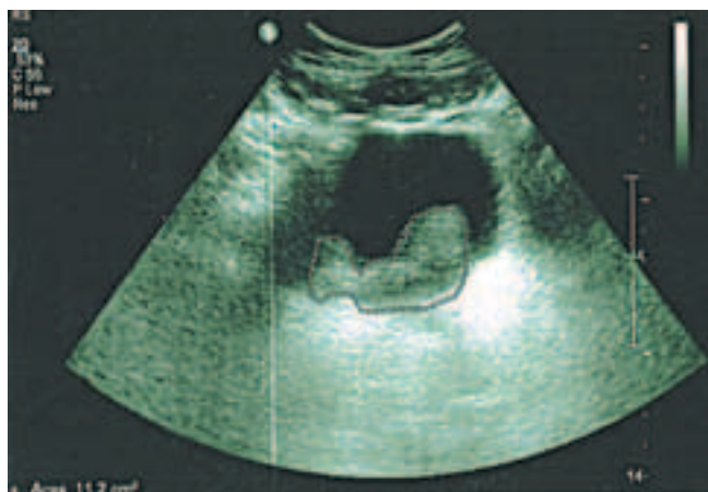
Рис. 3. УЗИ: образование в области шейки МП

Вопросы хирургического лечения местно-распространенного РПЖ остаются спорными, однако РПЭ в качестве этапа мультимодальной терапии может рассматриваться как возможный метод лечения при строгом отборе пациентов. При развитии местного рецидива в области шейки МП РЦЭ с целью локального контроля заболевания и сохранения функции почек является потенциально возможной опцией для тщательно отобранных больных.