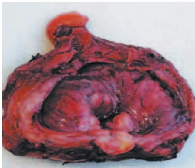
Рис. 4. Макропрепарат после РЦЭ

Учитывая местный рецидив РПЖ в области шейки МП, рецидивирующие стриктуры (компрессию) УВА, двустороннее нарушение уродинамики с развитием почечной недостаточности, с циторедуктивной целью, а также с целью улучшения качества жизни, сохранения функции почек пациенту 21.12.2011 г. выполнили оперативное вмешательство в объеме РЦЭ, формирования илеокондуита по Брикеру. Интраоперационно: трудности при диссекции МП ввиду выраженного рубцового процесса вследствие перенесенной РПЭ. Шейка МП содержит опухолевые узлы, плотно фиксирована к тазу. Справа и слева имеются признаки распространения опухоли за пределы МП. После удаления МП в ложе (по передней стенке прямой кишки) располагаются плотные опухолевые массы, которые максимально иссечены. Время операции — 340 мин, объем кровопотери — 150 мл. Макропрепарат представлен на рис. 4. При контрольном УЗИ нарушений уродинамики с обеих сторон не выявлено. Гистологическое заключение: опухолевое образование в области шейки МП представлено разрастанием умеренно- и низкодифференцированной аденокарциномы с инфильтрацией всех слоев, покровный эпителий МП над опухолью истончен, местами эрозирован. В отдельных присланных фрагментах фиброзно-мышечной стромы инфильтративный рост выше описанной опухоли. В участках мочеточников роста опухоли не обнаружено,