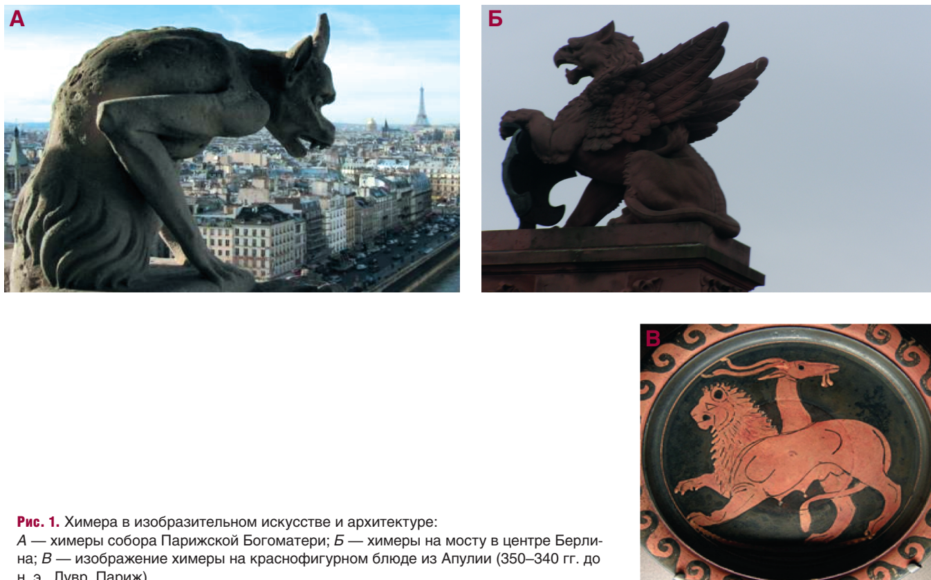
Рис. 1. Химера в изобразительном искусстве и архитектуре:

А — химеры собора Парижской Богоматери; Б — химеры на мосту в центре Берлина; В — изображение химеры на краснофигурном блюде из Апулии (350–340 гг. до н. э., Лувр, Париж)