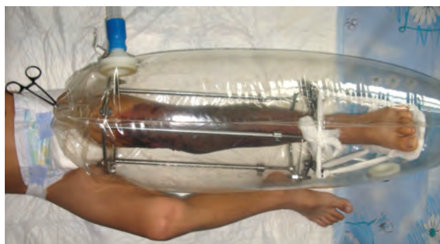
Рис. 5. Лечение левой нижней конечности в изоляторе УАС

ли приобретать физиологическую окраску, что свидетельствовало о их жизнеспособности, отмечено раннее появление грануляций.