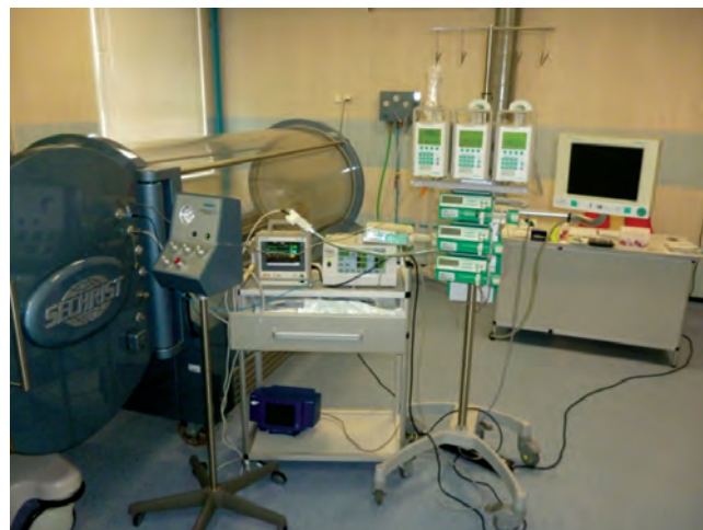
Рис. 1. Реанимационная барокамера Sechrist-3200 (США) с респиратором Sechrist Model 500A Hyperbaric Ventilator (США), монитором ЖВФ и модулем для инфузии

Метод ГБО в комплексном лечении ран в период с 2012 по 2013 г. использовался у 106 детей в возрасте 9 \pm 4,5 года, находящихся на лечении в НИИ НДХиТ. Поскольку в клинику дети поступали на разных сроках течения раневого процесса, в исследовании были выделены 2 группы. В 1-й группе ( n = 66 ) сеансы ГБО проводились в предоперационном периоде, во 2-й группе ( n = 40 ) – в послеоперационном. Учитывая тяжесть пациентов, сложность течения раневого процесса, лечение ран было комплексным, включающим: