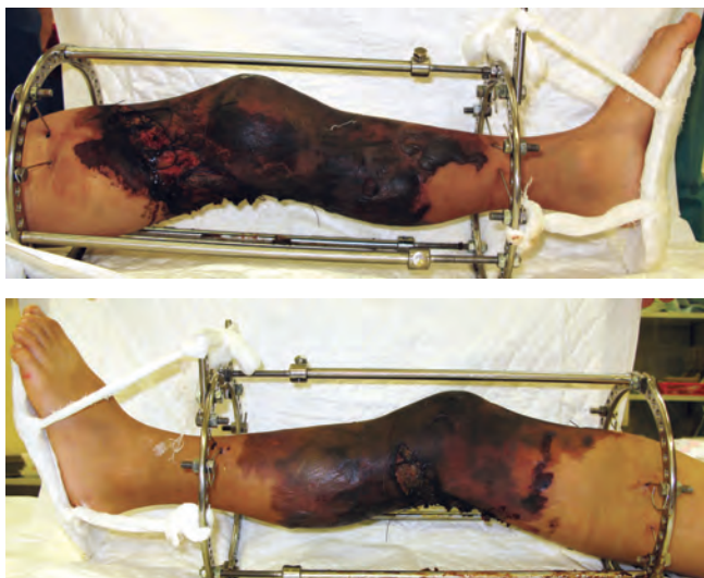
Рис. 6. Вид раневой поверхности после 10 сеансов ГБО