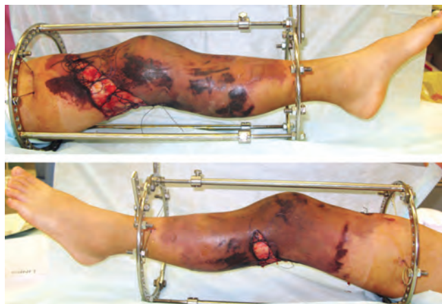
Рис. 4. Вид кожного лоскута после 3 сеансов ГБО