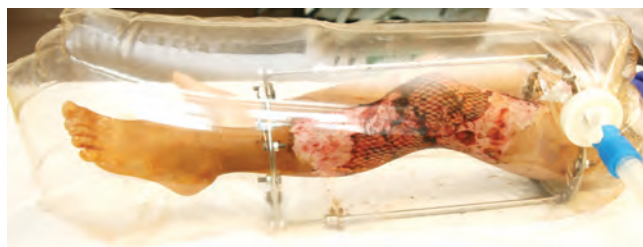
Рис. 9. Местное лечение после аутодермопластики в изоляторе УАС

результат лечения представлен на рис. 10. Кожные ауто-трансплантаты прижились удовлетворительно, функция конечности полностью восстановилась, ребенок в удовлетворительном состоянии выписан домой через 1,5 мес после поступления.