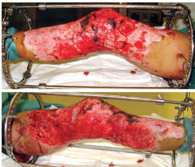
Рис. 7. Вид раневой поверхности после хирургической обработки

Местное лечение в условиях УАС в сочетании с ГБО позволили перевести течение раневого процесса из первой фазы во вторую, добиться четкой демаркации нежизнеспособных тканей и эпителизации около 25 % раневой поверхности (рис. 7).