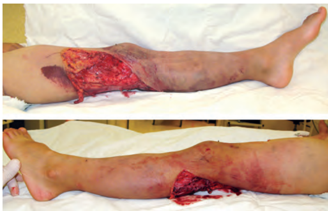
Рис. 3. Внешний вид скальпированной раны левого бедра и голени при поступлении

Учитывая сомнительную жизнеспособность кожно-жирового лоскута и подкожно-жировой клетчатки, отсутствие четких границ участков размозжения мышц голени, было принято решение о проведении курса ГБО. Давление на изопрессии в камере не превышало 1,2–1,5 АТА, длительность сеанса 60 мин. После проведения 3 сеансов ГБО на скальпированном лоскуте и краях раны стали появляться участки демаркации черного цвета на фоне темно-синюшного цвета кожи (рис. 4). Ткани сомнительной жизнеспособности на отдельных участках ста-