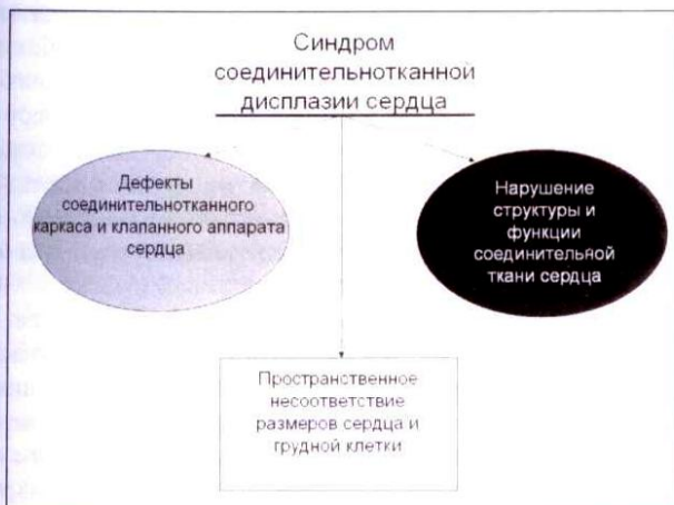
Рис. 1. Три составляющие синдрома соединительнотканной дисплазии сердца

СТДС, как нам представляется, имеет три составляющих: ремоделирование сердца при костно-скелетных деформациях грудной клетки, дефекты и аномалии соединительнотканного каркаса и клапанного аппарата сердца и нарушения структуры и функции соединительной ткани и межтканевых отношений (рис.1). Рассмотрим подробнее названные составляющие.