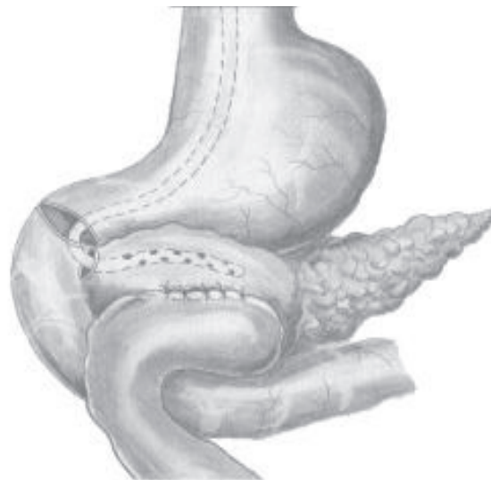
Рис. 4. Дуоденоцистоеюностомия