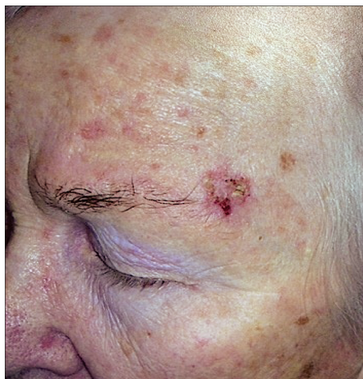
Рис. 6. Больная Т. Дерматогелиоз, актинический кератоз, базально-клеточный рак кожи левой височной области.

Лечение: на элементы актинического кератоза назначены аппликации 0,05% ретиноевой мази 2 раза в