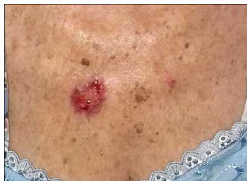
Рис. 5. Дерматогелиоз, нодулярно-язвенный базально-клеточный рак кожи груди.

дермисом обнаружен гипозоженный очаг неправильной формы, с четкими границами, занимающий верхнюю половину дермы.