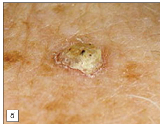
Рис. 2. Лимонная кожа Миллиана. а – солнечный эластоз; б – актинический кератоз.