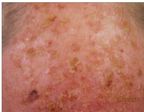
Рис. 4. Множественные элементы актинического кератоза, лентиго.

УЗ-исследование кожи лица (75 мГц): эпидермис высокой экзогенной плотности, обычной толщины; под эпи-